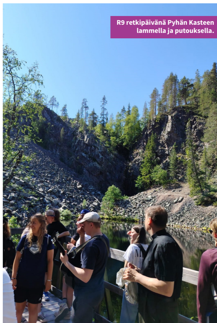
R9 retkipäivänä Pyhän Kasteen lammella ja putouksella.

Kemijärven-viikon jälkeen oli mukava palata kotiin ja arkeen. Alun läkähdyttävän kuumuuden jälkeen bussimatka sujui leppoisasti pilvien tummussa ja sään viilentessä. Ruokana toimivat huoltoasemalle tilatut herkut, musiikkina gospel-levy-raadin monimuotoiset hengelliset kappaleet. Voittajaksi selviytyi The Rain -yhtyeen Tuuli kulkee , jonka puhujan tavoin leiriläiset saattavat vielä pohtia omaa rippikouluaikaansa. Samoin he saavat muistella konfirmaatiotaan Raahen kirkossa 27.7.