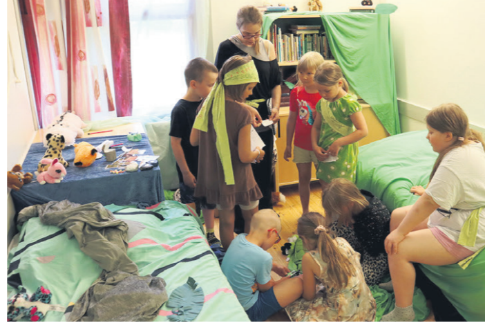
Raahen seurakunta haluaa tarjota kaikille lapsille ja nuorille yhtäläisen mahdollisuuden osallistua esimerkiksi leireille. Kuva Kultalan kesäleiriltä vuodelta 2023. (Kuvituskuva. Kuvan lapset eivät liity tämän jutun aiheeseen.)

– Näissä kauemmas suuntautuvissa retkissä joudutaan käyttämään enemmän harkintaa ja rajaamaan, kuinka monelle voidaan myöntää maksuvapautusta. Näissä kuitenkin yli puolet kokonaiskuluista tulee sisäänpääsymaksuista. Sakari muistuttaa, että seurakunnan diakoniatyöltä voi anoa