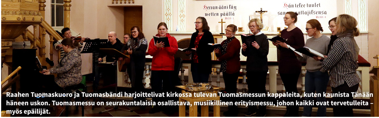
Raahen Tuomaskuoro ja Tuomasbändi harjoittelevat kirkossa tulevan Tuomasmessun kappaleita, kuten kaunista Tänään häneen uskon. Tuomasmessu on seurakuntalaisia osallistava, musiikillinen erityismessu, johon kaikki ovat tervetulleita – myös epäilijät.

Tuomaskuoron harjoitukset ovat joka toinen keskiviikko. Tuomasmessuja on Raahessa kolme kertaa kevään ja kaksi kertaa syksyisin, jokainen